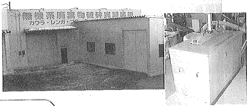
当社が開発した パネル破碎装置の一部